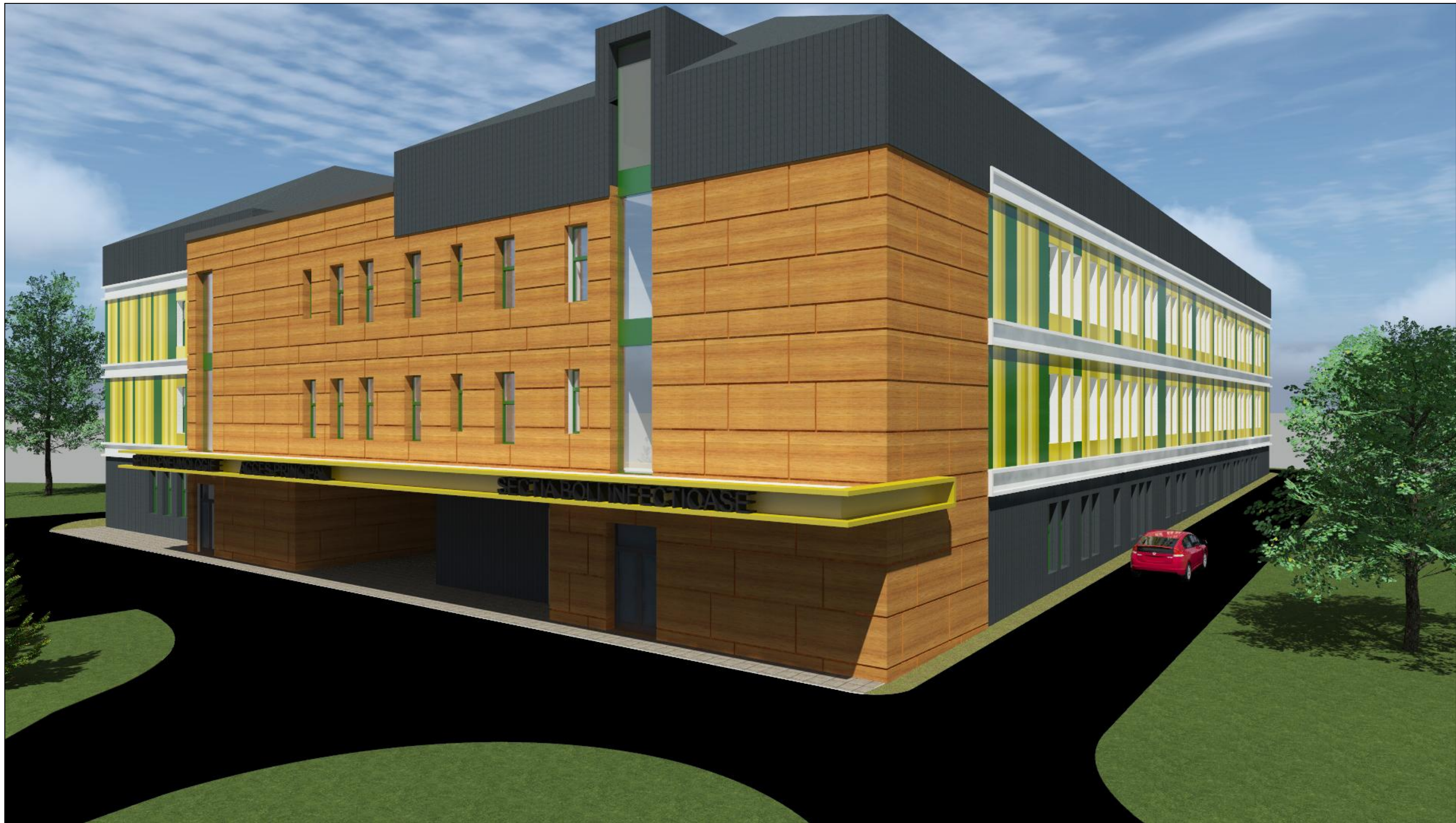
PERSPECTIVA VAR.2 - VEDERE FATADA PRINCIPALA