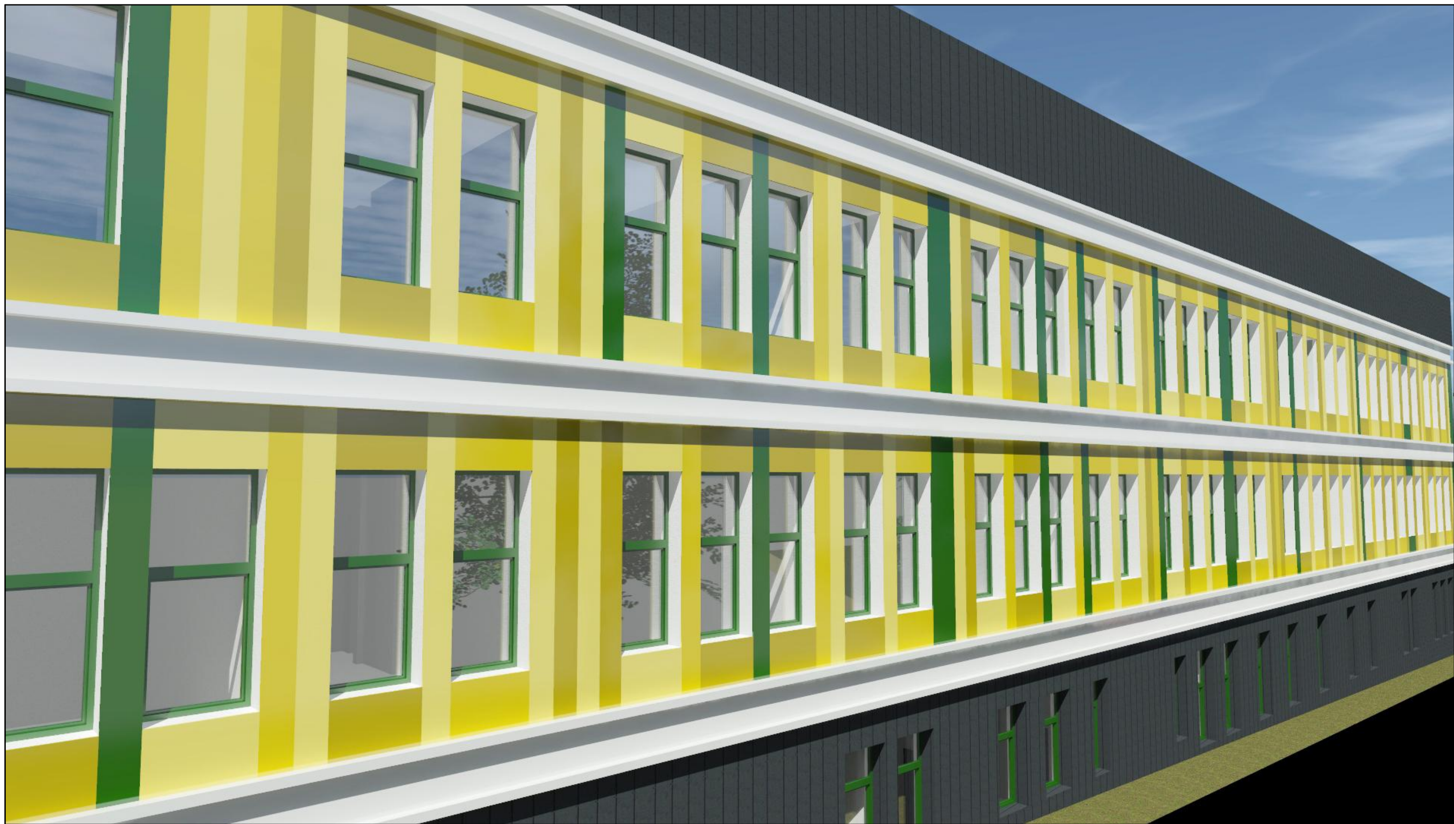
PERSPECTIVA VAR.2 - VEDERE FATADA LATERALA