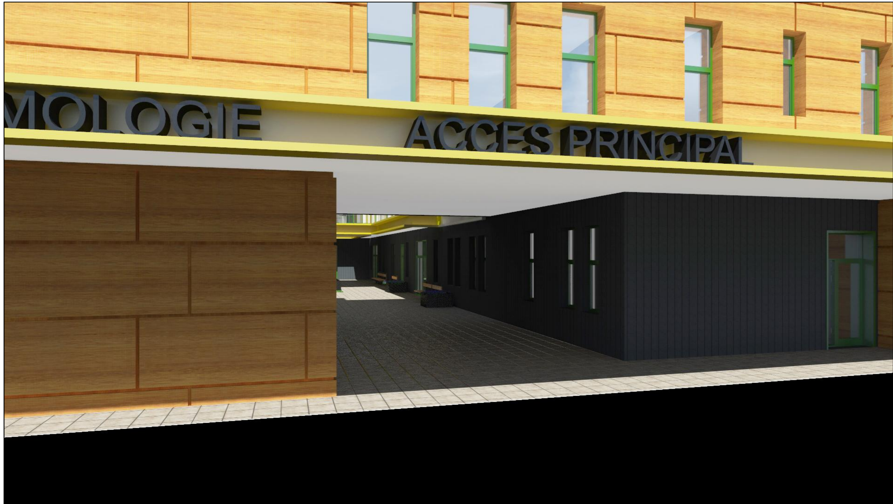
PERSPECTIVA VAR.2 - DETALIU ACCES