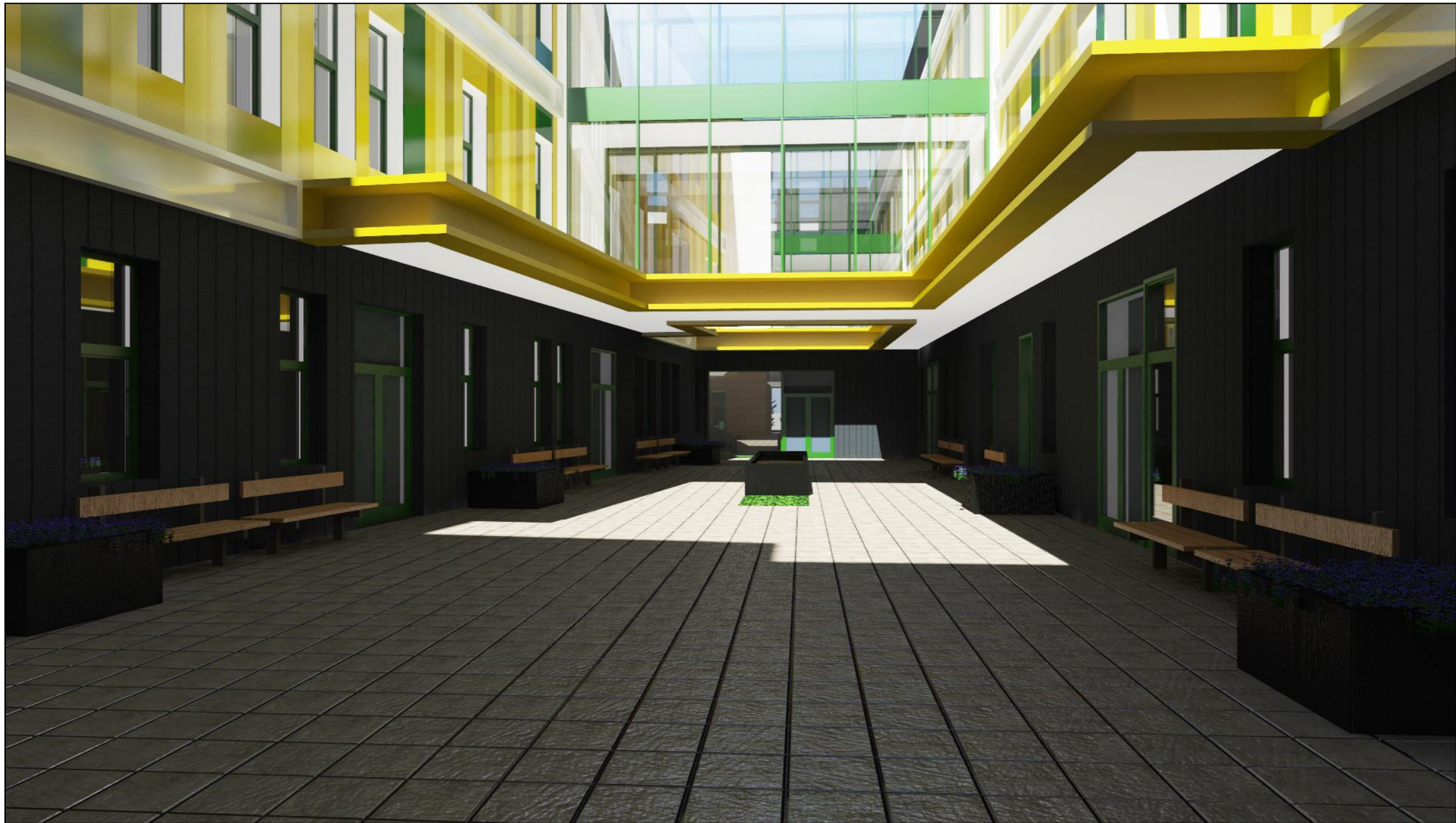
PERSPECTIVA VAR.2 - VEDERE CURTE INTERIOARA