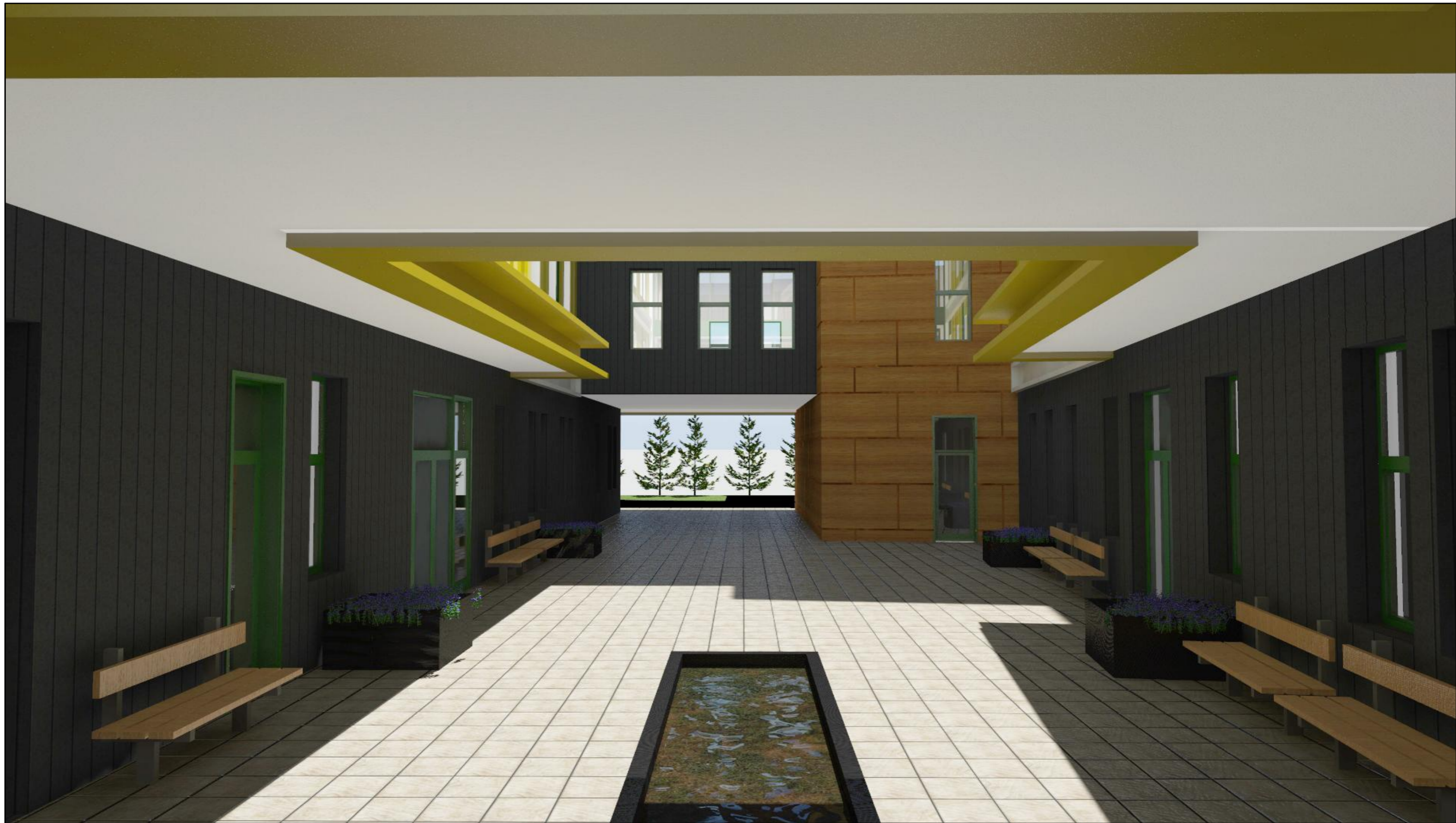
PERSPECTIVA VAR.2 - VEDERE CURTE INTERIOARA