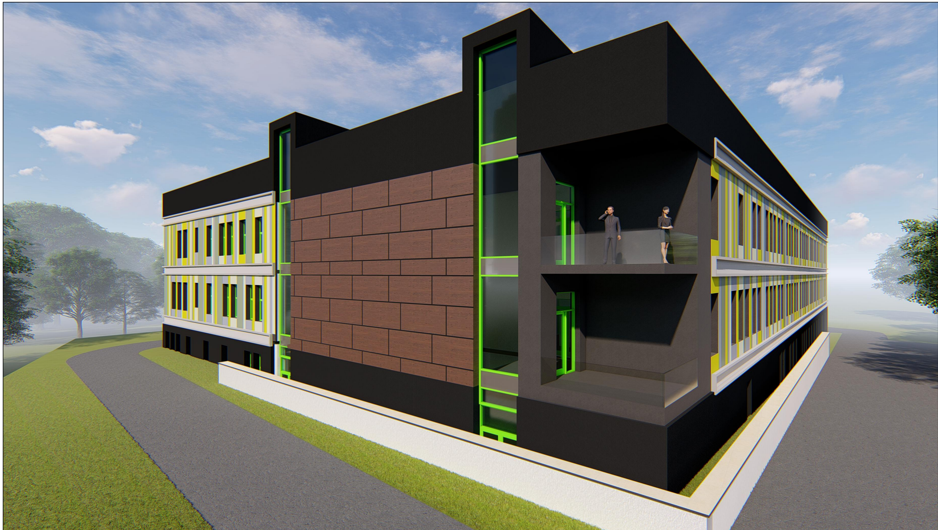
PERSPECTIVA VAR.3 - VEDERE FATADA POSTERIOARA