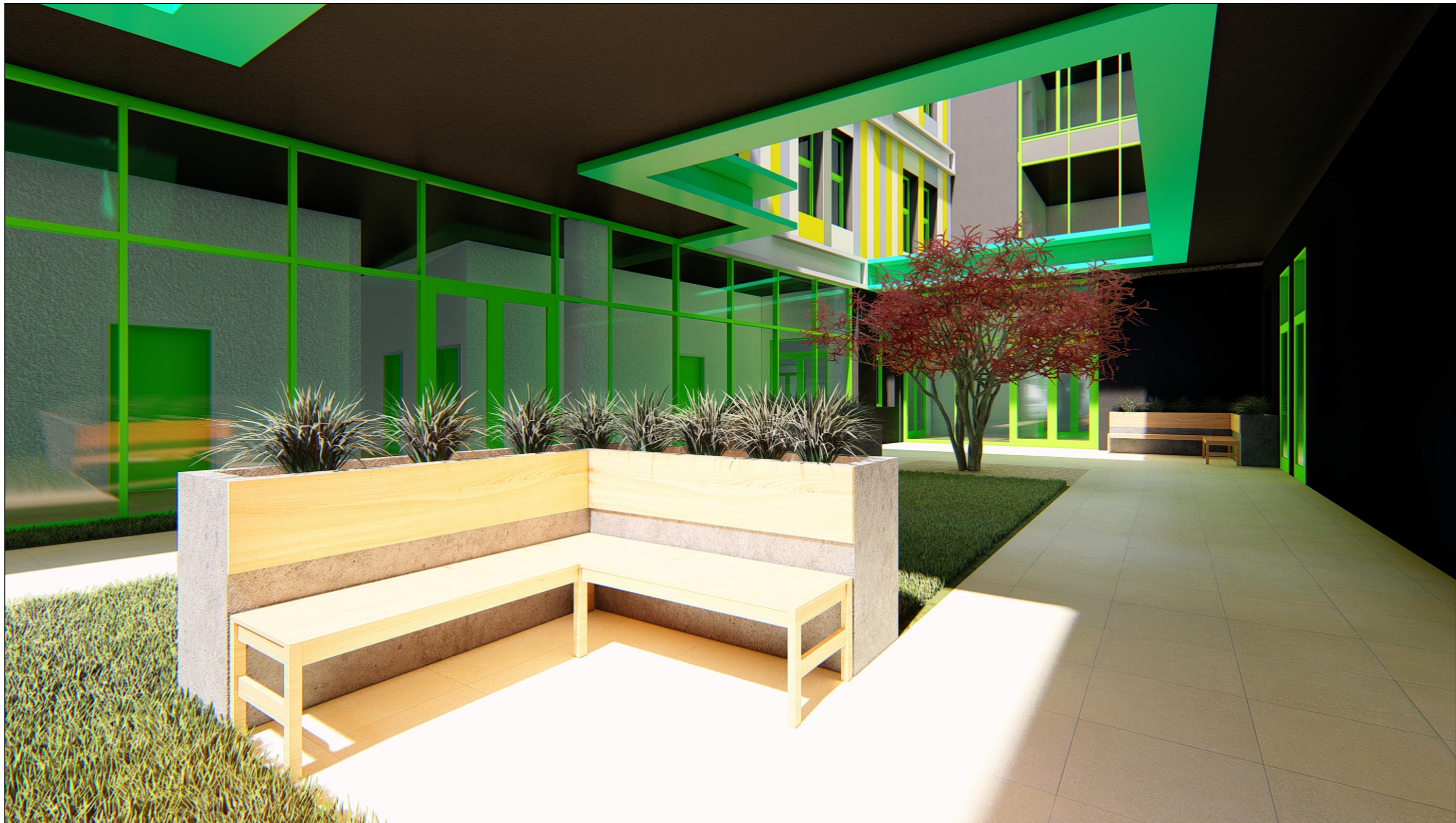
PERSPECTIVA VAR.3 - VEDERE CURTE INTERIOARA